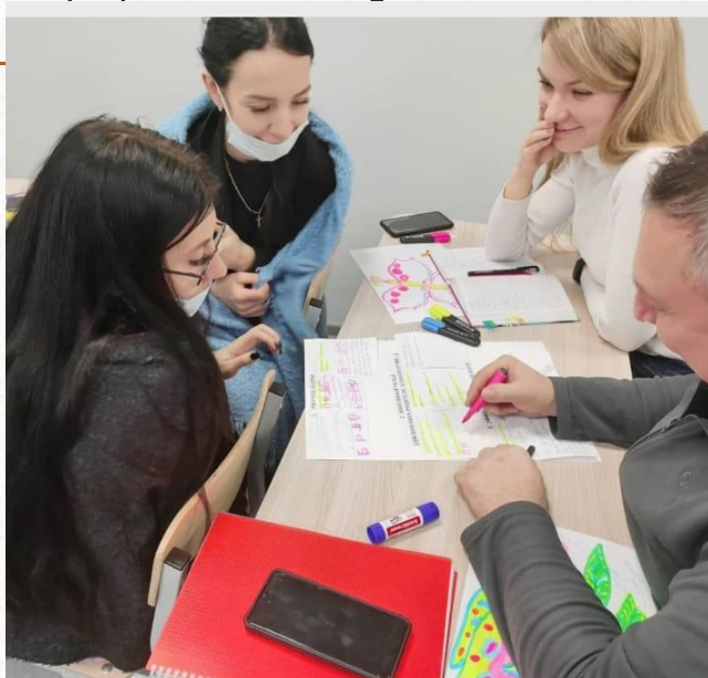
Нравится: 43 sredniaishkolainternat Педсовет: "500+" :старт в развитие. 29 декабря 2021 г.